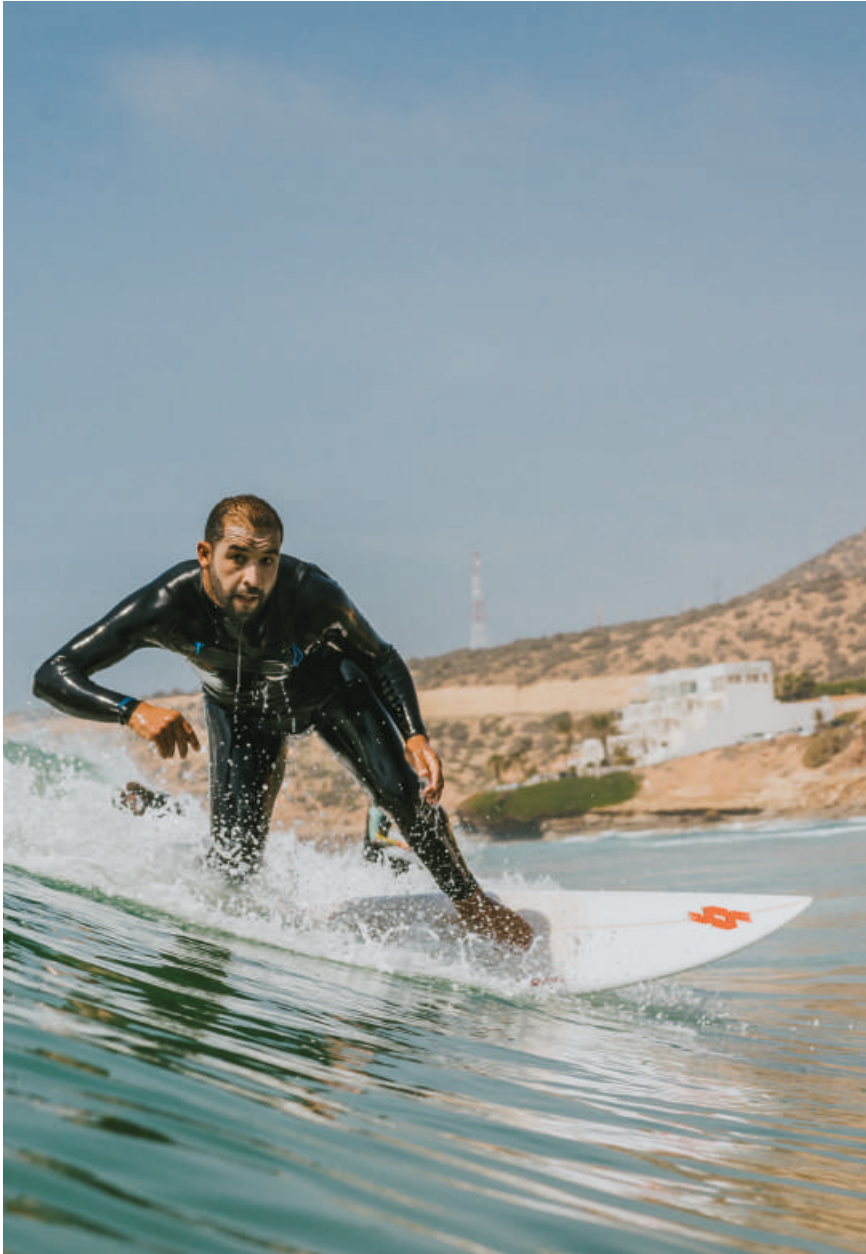
Alvaro Montero/ @alvaromonterophoto