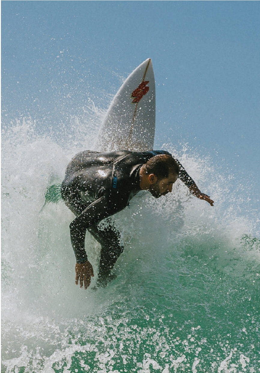
Alvaro Montero/ @alvaromonterophoto