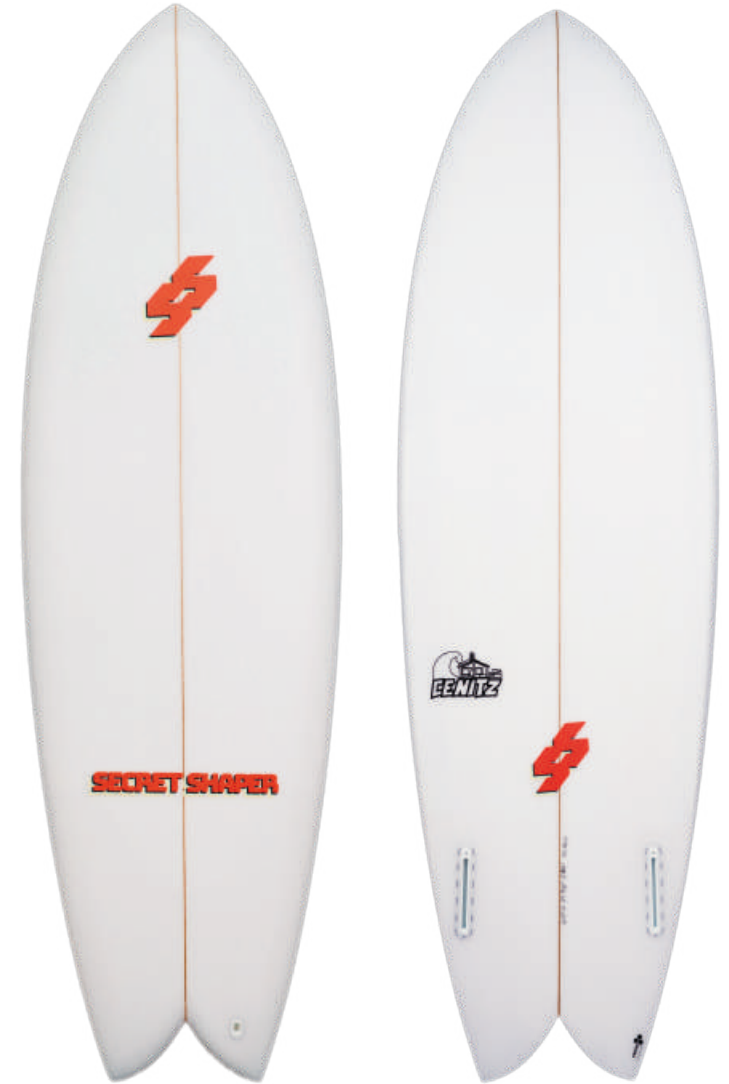
Mintautas Grigas / @mintukass