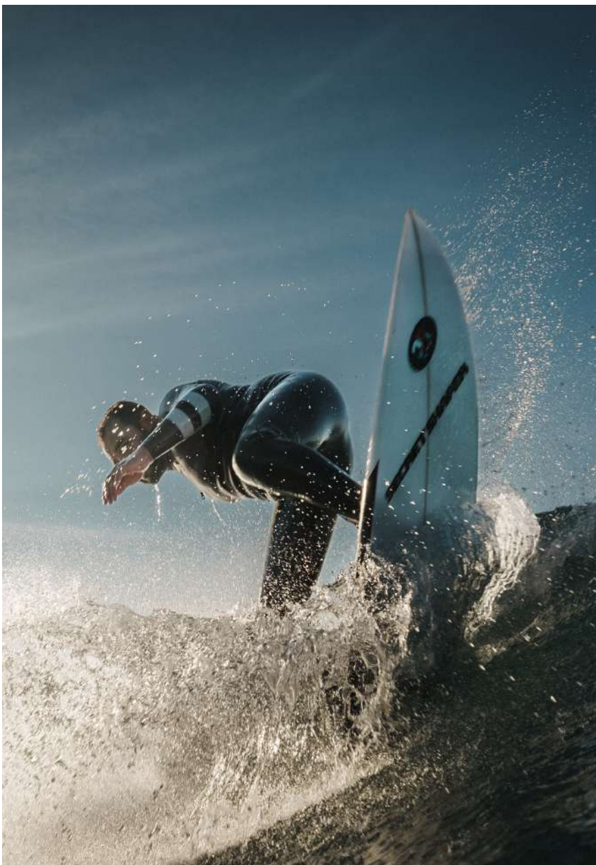
Alvaro Montero / @alvaromonterophoto