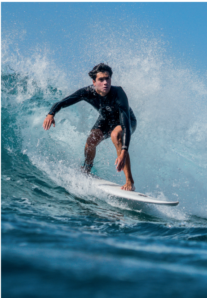
Quim Valls / @wet.penguins