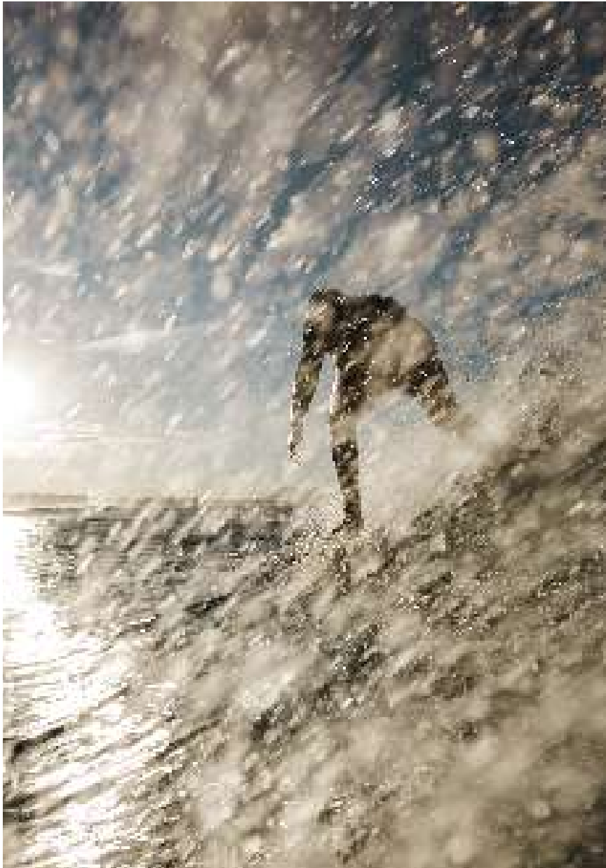
Mintautas Grigas / @mintukass