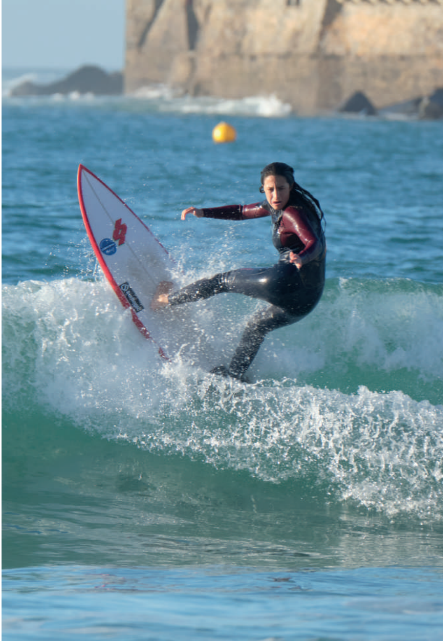
Iur Gi / @iurgiurigi