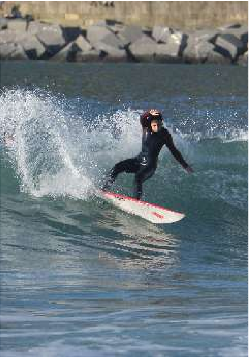
Iur Gi / @iurgiurgi